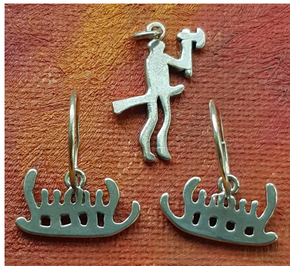
Bilde 2: Sølvsmykkene fra Vitlycke.