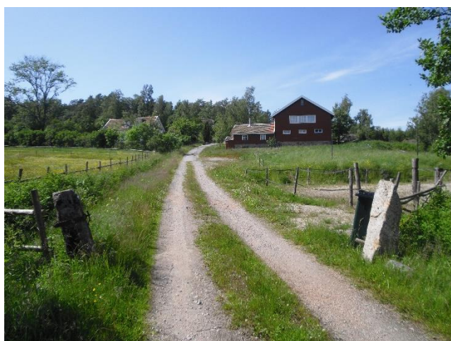
Bilde 1: Mine røtters allé.

Vi ruslet rundt på de ulike områdene – helleristningene var store og mangfoldige, og det hvilte en slags ro der – eller bare at jeg fant roen i meg, kanskje? Jeg vet ikke. Men jeg kjente på en viss tilknytning, så da vi gikk på museet, hadde jeg behov for to ting: Jeg ville kjøpe noen sølvsmykker som minne om stedet, samt spørre om de visste hvor mine tippoldeforeldre bodde. Utrolig nok kunne de forklare hvor det var mest sannsynlig oldemor kom fra – og ikke var det