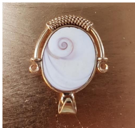
Bilde 3: Baksiden på et «Naxos øye» smykke (som heller ikke har blitt brukt...!) viser en nydelig spiral! Foto: M. L. Tverlid

kvistgjengeren en tilknytning til en sjelefamilie - Fuglefolket – ut i fra flere attributter risset inn. Muligens en Eben/hamskifter. Hun ser hele scenen som reinens tilblivelse - at DNA har blitt gitt for å lege reinsdyret. Hun gjør et frampek mot slutten av artikkelen om at kanskje historien, og vår tilblivelse, må skrives om. Her ble jeg bare sittende og undre – uten at jeg klarte å stille spørsmål i meg selv. Jeg så ikke den klare linken, men bare kjente det på meg at den er viktig. Det følte som om historiene/artiklene formet en spiral, eller labyrint, og at min bevissthet gikk i flere sirkler- som om jeg ble ledet til "målet"/fokuset i midten.